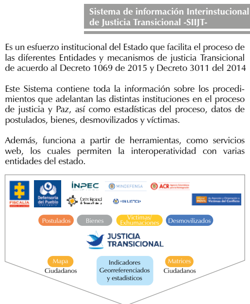
Figura 4. Sistema de información interinstitucional de Justicia Transicional.

marcas de aplicación de justicia relacionados con los delitos provocados por el conflicto armado. Es decir, la justicia especial para la paz solo tiene validez por la vía de la transicional.