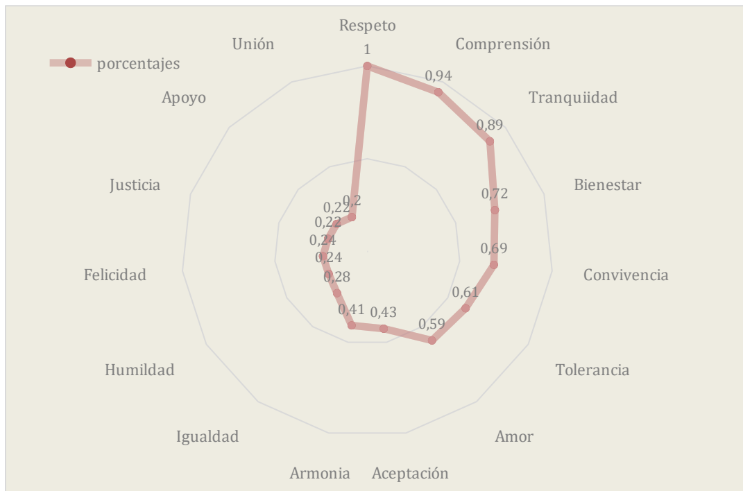
Figura 1. Núcleo de Red